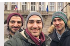
Band „Samras“ aus Aleppo, u. a. interkulturelle Musikgruppen