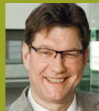
Uwe Heimowski Politikbeauftragter am Dt. Bundestag